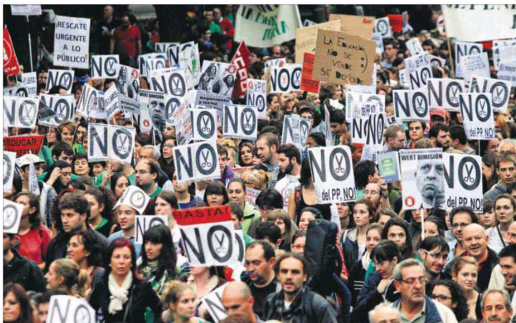
Miles de personas protestaron ayer por las calles de Madrid contra los recortes y contra la reforma educativa.