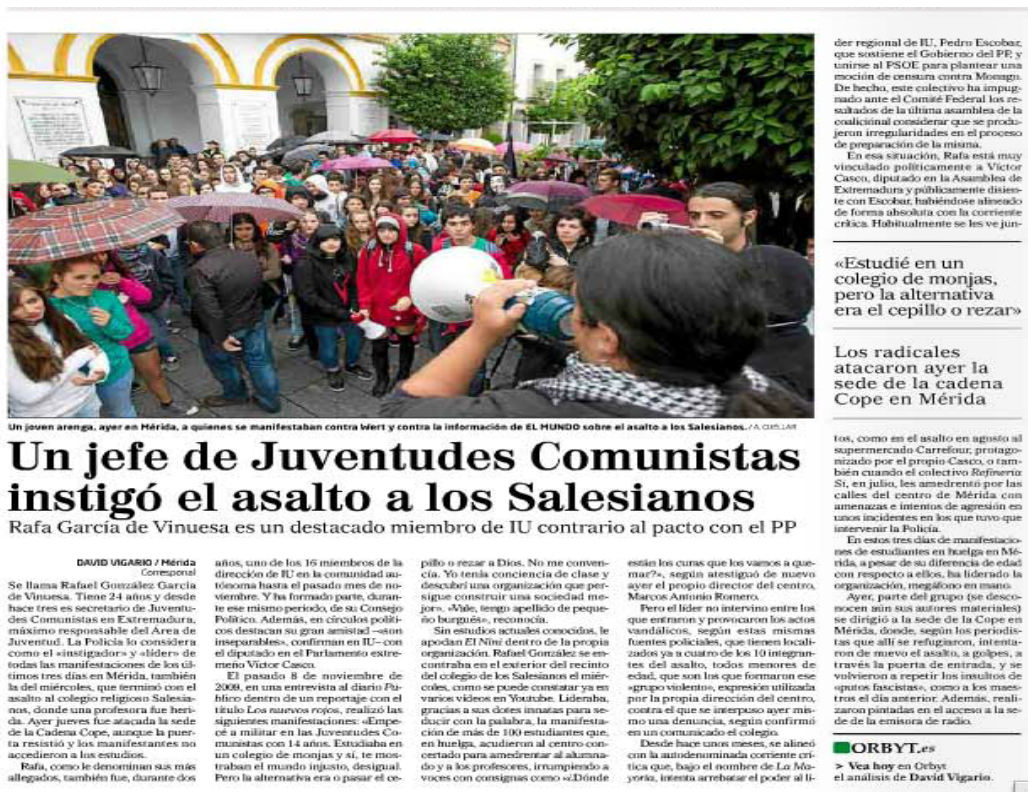
Imagen 1. Información del periódico El Mundo sobre la huelga general de educación del 18/10/2012

El País por su parte, tiene dedicados tres o cuatro periodistas a las noticias sobre Educación, que se ocupan de este asunto desde hace tiempo. Estos periodistas producen materiales tanto para la versión impresa como para la digital. Se trata, en general, de textos articulados que cubren el asunto de forma más continuada con una calificación en los titulares del tipo “Conflicto en Educación” “Tijeretazo”, que anticipan claramente el contenido del relato. Transmite así la idea de una fuerte conflictividad y, en general, recoge las perspectivas de las plataformas y organizaciones opuestas al Gobierno, especialmente de la Confederación Española de las Asociaciones de Padres y Madres de Alumnos (CEAPA) y del Sindicato de Estudiantes (imagen 2). En esa misma línea, se insiste mucho en el detalle de las cifras de los recortes: decenas de miles de profesores menos, pérdida de programas de apoyo a los estudiantes, disminución de becas y ayudas para libros de texto y comedor, importantes aumentos del precio de las matrículas universitarias, etc. Finalmente (y en esto coincide con lo que hace también El Mundo ) recurre frecuentemente a los “testimonios”, subrayando cómo el asunto afecta al ciudadano corriente que viene mencionado y presentado en su relato.